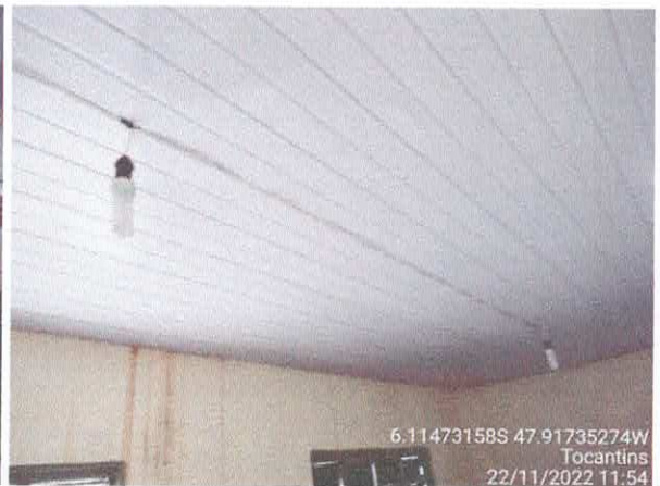
Foto 76: Sala da coletoria: paredes com rachaduras. Paredes com infiltração. Fiação exposta, esquadrias danificadas.