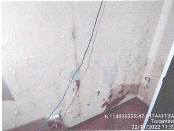
Foto 43: Sec. Educação: Vazamento do telhado. infiltração e paredes danificadas com revestimento solto, fiação exposta