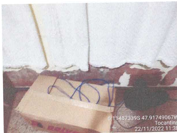
Foto 39: Sala da licitação: Vazamento do telhado. infiltração e paredes danificadas com revestimento solto.