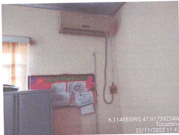
Foto 51: Sala do gabinete a ser reformulada. Paredes a serem demolidas. Paredes com infiltração.