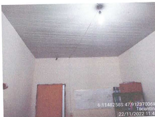
Foto 55: Sala do gabinete a ser reformulada. Paredes a serem demolidas. Paredes com infiltração. Portas danificadas.