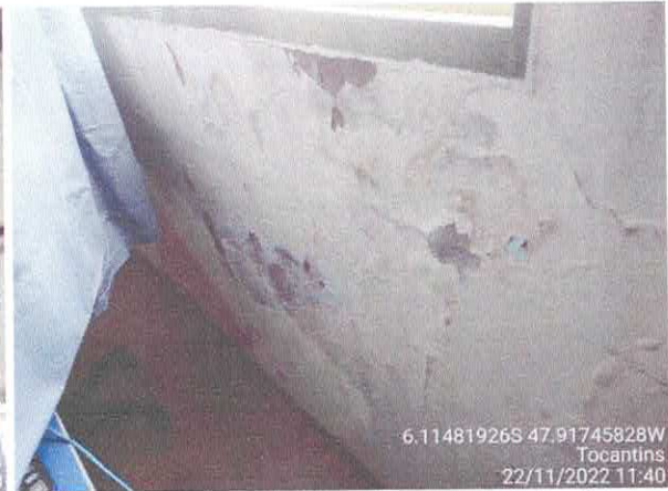
Foto 46: Sec. Educação: Vazamento do telhado. infiltração e paredes danificadas com revestimento solto, fiação exposta.