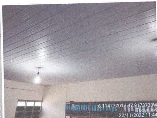
Foto 66: Sala da contabilidade a ser reformulada. Paredes a serem demolidas. Paredes com infiltração. Fiação exposta, esquadrias danificadas.