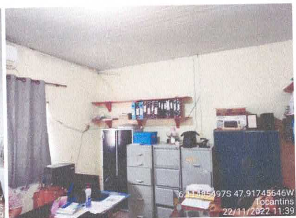
Foto 42: Sec. Educação: Vazamento do telhado. infiltração e paredes danificadas com revestimento solto, fiação exposta.

PREFEITURA Fis. 280 Rubrica C CACHOEIRINHA-T