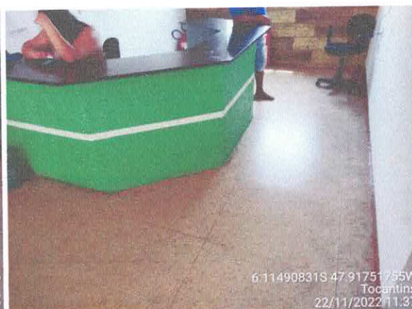
Foto 30: Recepção existente será reformulada, vai. passar a ser sala de RH e Sec. Finanças.