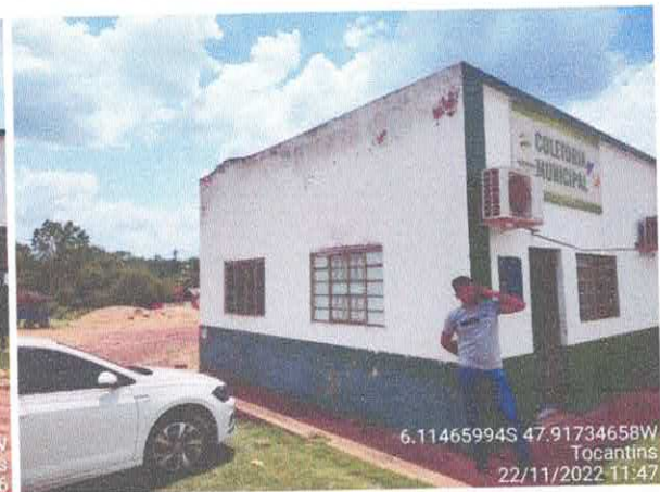
Foto 03: Fachada principal do prédio da prefeitura. Foto 04: Fachada lateral do prédio da prefeitura.