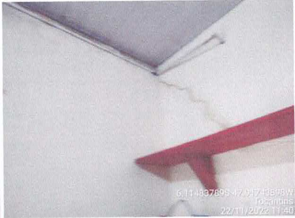
Foto 44: Sec. Educação: Vazamento do telhado. infiltração e paredes danificadas com revestimento solto, fiação exposta.