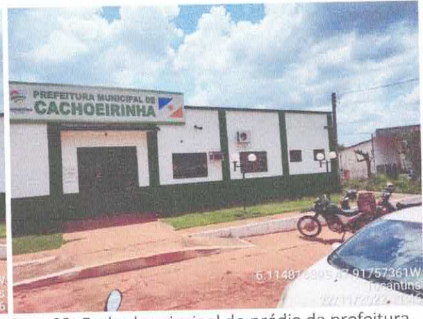
Foto 01: Fachada principal do prédio da prefeitura. Foto 02: Fachada principal do prédio da prefeitura.