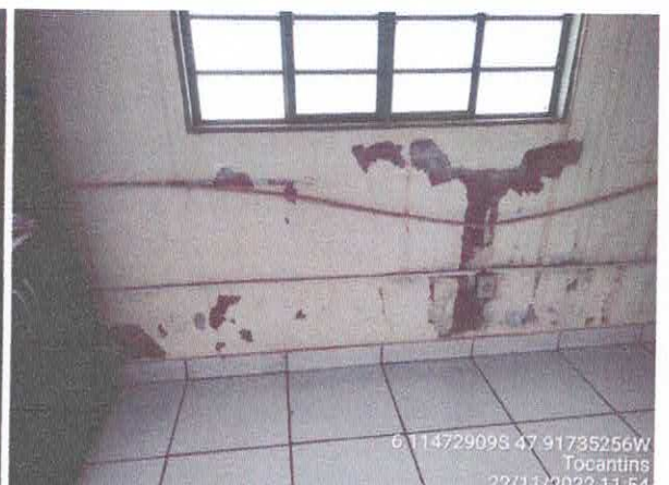
Foto 78: Sala da coletoria: paredes com rachaduras. Paredes com infiltração. Fiação exposta, esquadrias danificadas.