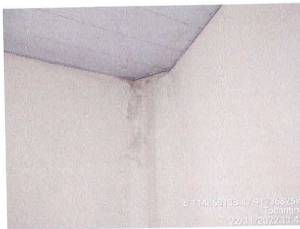
Foto 53: Sala do gabinete a ser reformulada. Paredes a serem demolidas. Paredes com infiltração.