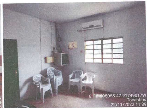
Foto 40: Sala chefe gabinete: Vazamento do telhado. infiltração e paredes danificadas com revestimento solto, fiação exposta.