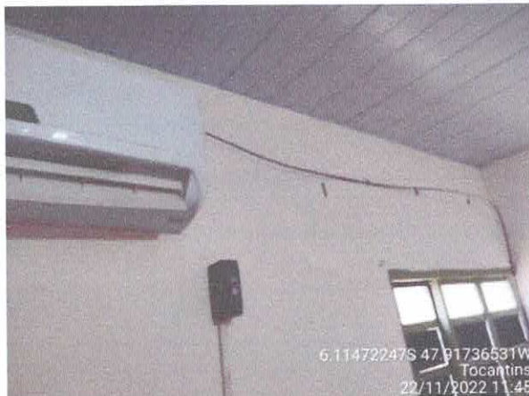
Foto 69: Sala da contabilidade a ser reformulada. Paredes com rachaduras. Paredes com infiltração. Fiação exposta, esquadrias danificadas.