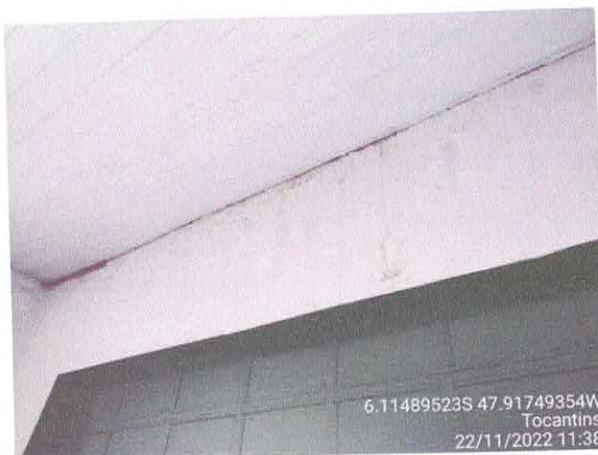
Foto 33: Vazamento geral do telhado. Telhas quebradas e calhas danificadas.