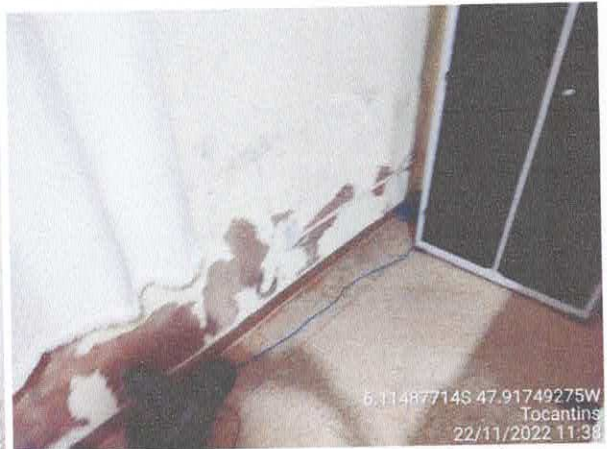
Foto 38: Sala da licitação: Vazamento do telhado. infiltração e paredes danificadas com revestimento solto.