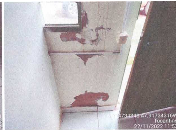
Foto 74: Sala da coletoria: paredes com rachaduras. Paredes com infiltração. Fiação exposta, esquadrias danificadas.