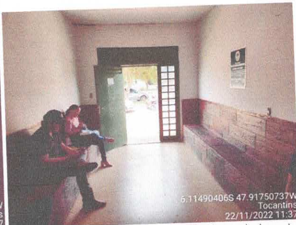
Foto 32: Recepção existente será reformulada, vai passar a ser sala de RH e Sec. Finanças.