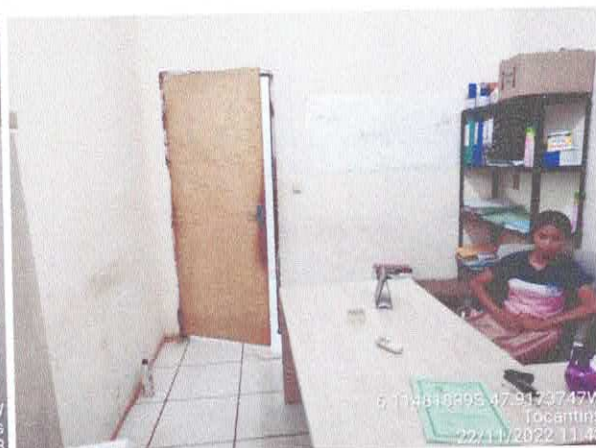
Foto 56: Sala do gabinete a ser reformulada. Paredes a serem demolidas. Paredes com infiltração. Portas danificadas.