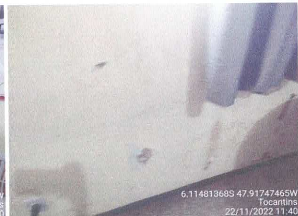
Foto 44: Sec. Educação: Vazamento do telhado. infiltração e paredes danificadas com revestimento solto, fiação exposta.