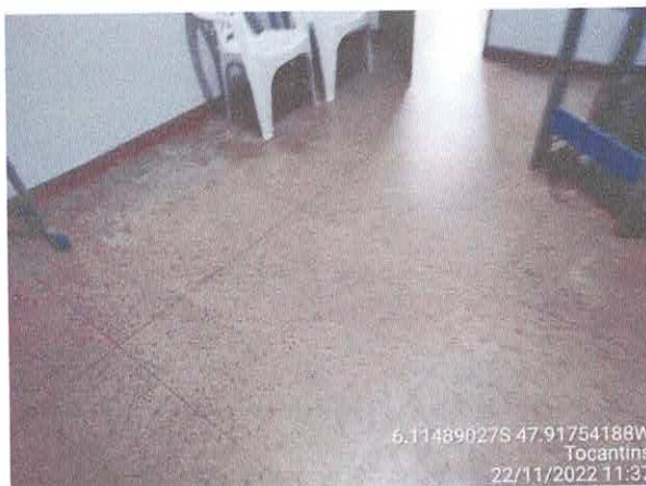
Foto 29: Patrimonio – infiltrações, vazamento do. T elhado, piso em granitina existente.