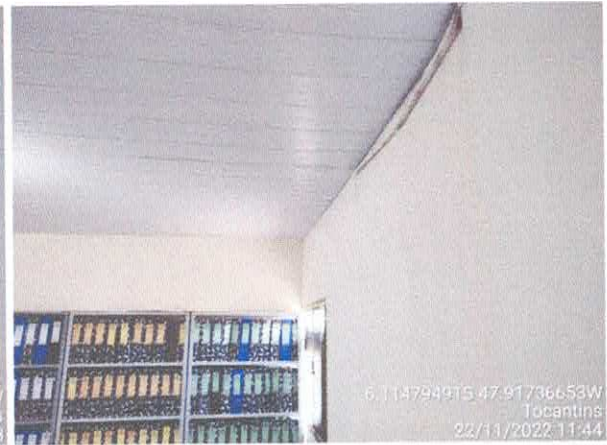
Foto 60: Sala da contabilidade a ser reformulada. Paredes a serem demolidas. Paredes com infiltração. Fiação exposta, esquadrias danificadas.