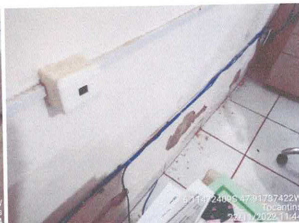
Foto 68: Sala da contabilidade a ser reformulada. Paredes a serem demolidas. Paredes com infiltração. Fiação exposta, esquadrias danificadas.

RECURSOS Fls. 285 Rubrica CACHOEIRINHA-TO