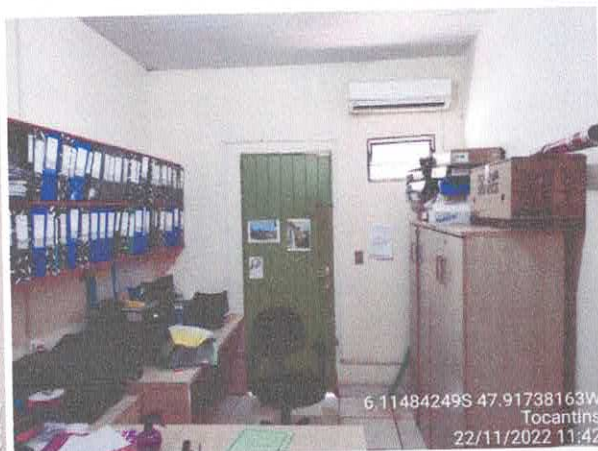
Foto 54: Sala do gabinete a ser reformulada. Paredes a serem demolidas. Paredes com infiltração.