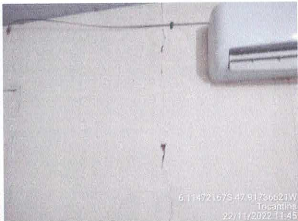
Foto 70: Sala da contabilidade a ser reformulada. Paredes com rachaduras. Paredes com infiltração. Fiação exposta, esquadrias danificadas.