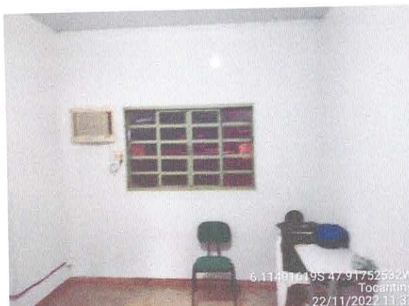
Foto 27: Patrimonio – infiltrações, vazamento do. Telhado, piso em granitina existente.