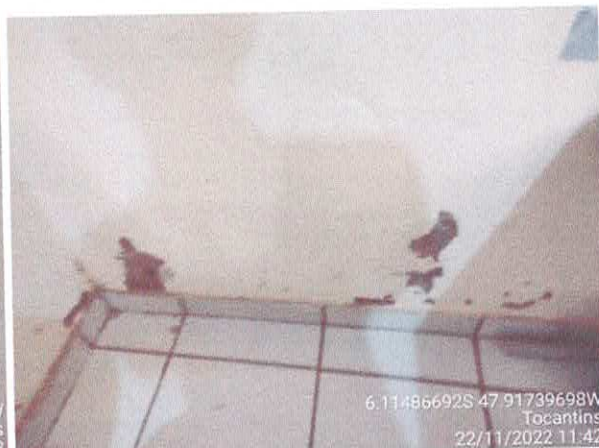
Foto 52: Sala do gabinete a ser reformulada. Paredes a serem demolidas. Paredes com infiltração.