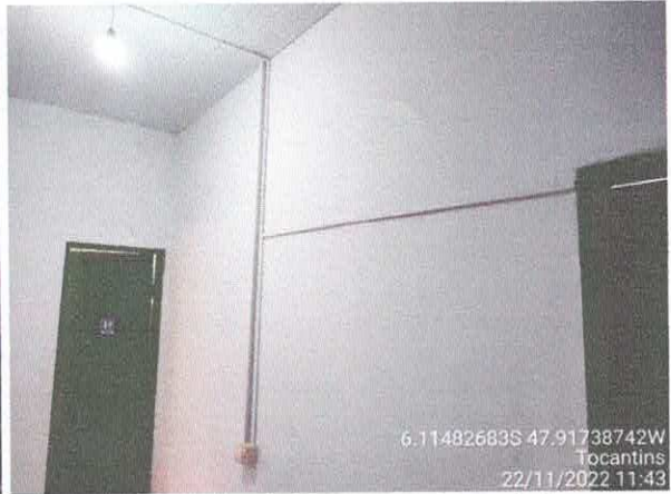
Foto 58: Sala do gabinete a ser reformulada. Paredes a serem demolidas. Paredes com infiltração. Fiação exposta, esquadrias danificadas.