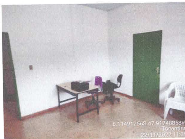
Foto 41: Sala chefe gabinete: Vazam. do telhado. infiltração e paredes danificadas com revestimento solto, fiação exposta