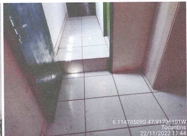
Foto 62: Sala da contabilidade a ser reformulada. Paredes a serem demolidas. Paredes com infiltração. Degrau no piso a ser retirado com a demolição do contra-piso e rebaixo do nível.