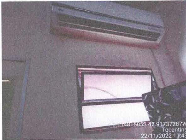
Foto 57: Sala do gabinete a ser reformulada. Paredes a serem demolidas. Paredes com infiltração. Fiação exposta, esquadrias danificadas.