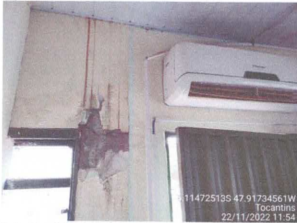
Foto 75: Sala da coletoria: paredes com rachaduras. Paredes com infiltração. Fiação exposta, esquadrias danificadas.