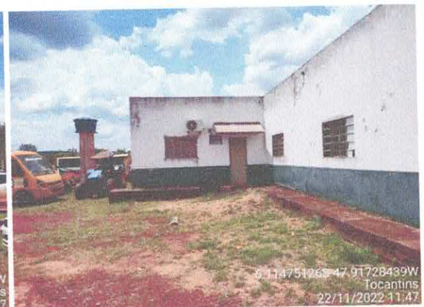
Foto 05: Fachada lateral do prédio da prefeitura. Foto 06: Fachada lateral do prédio da prefeitura.