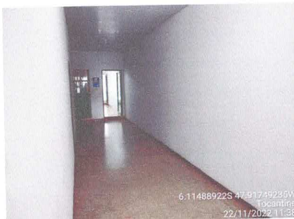
Foto 35: Será assentado piso em parcelanato sobre piso de granitina existente. Degrau em piso deverá ser executado rampa.