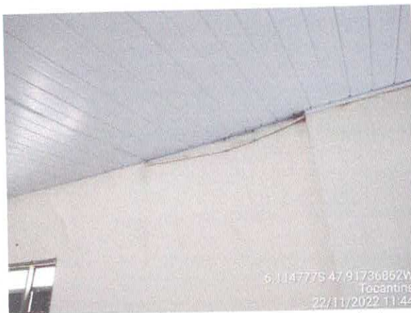
Foto 65: Sala da contabilidade a ser reformulada. Paredes a serem demolidas. Paredes com infiltração. Fiação exposta, esquadrias danificadas.