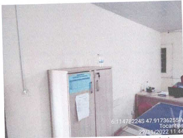
Foto 63: Sala da contabilidade a ser reformulada. Paredes a serem demolidas. Paredes com infiltração. Fiação exposta, esquadrias danificadas.