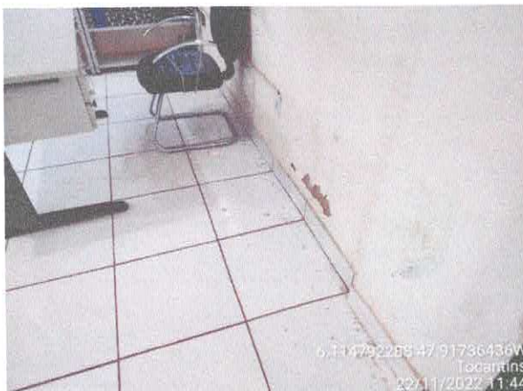
Foto 61: Sala da contabilidade a ser reformulada. Paredes a serem demolidas. Paredes com infiltração. Fiação exposta, esquadrias danificadas.