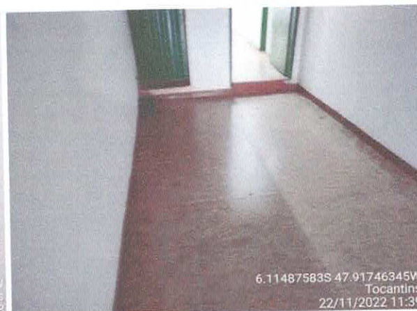
Foto 36: Será assentado piso em parcelanato sobre piso de granitina existente. Degrau em piso deverá ser executado rampa.

PREFEITURA Fls. 279 Rubrica. 8 RACHOÉ/PINHA-TO