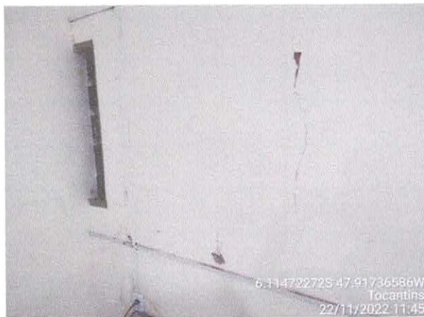
Foto 71: Sala da contabilidade a ser reformulada. Paredes com rachaduras. Paredes com infiltração. Fiação exposta, esquadrias danificadas.