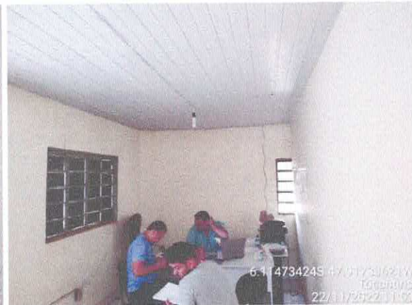
Foto 72: Sala da coletoria: paredes com rachaduras. Paredes com infiltração. Fiação exposta, esquadrias danificadas.