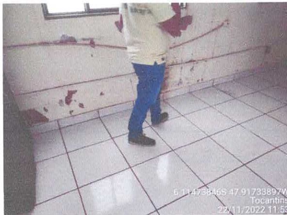
Foto 73: Sala da coletoria: paredes com rachaduras. Paredes com infiltração. Fiação exposta, esquadrias danificadas.