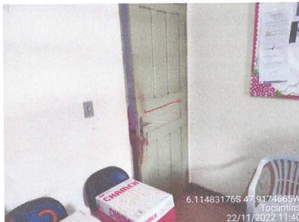
Foto 43: Sec. Educação: Vazamento do telhado. infiltração e paredes danificadas com revestimento solto, fiação exposta. Portas danificadas.