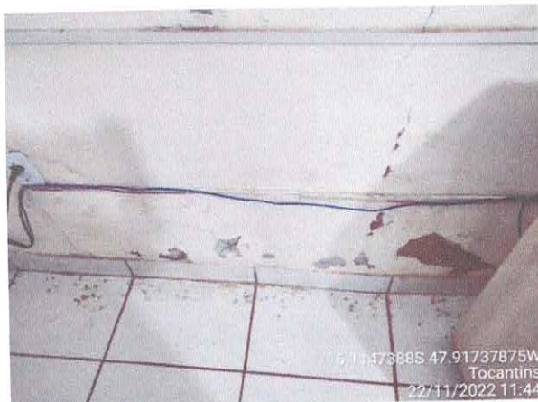
Foto 67: Sala da contabilidade a ser reformulada. Paredes a serem demolidas. Paredes com infiltração. Fiação exposta, esquadrias danificadas.