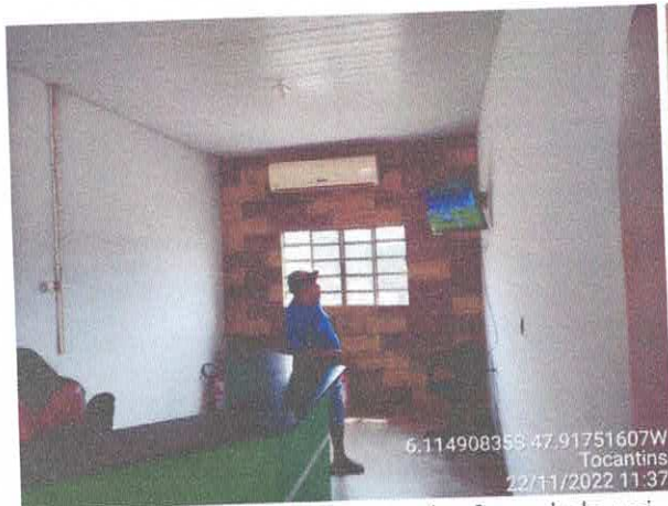
Foto 31: Recepção existente será reformulada, vai passar a ser sala de RH e Sec. Finanças.