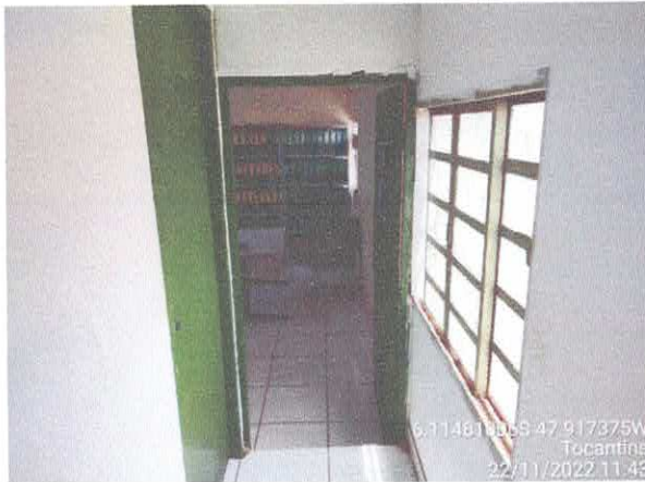
Foto 59: Sala da contabilidade a ser reformulada. Paredes a serem demolidas. Paredes com infiltração. Fiação exposta, esquadrias danificadas.