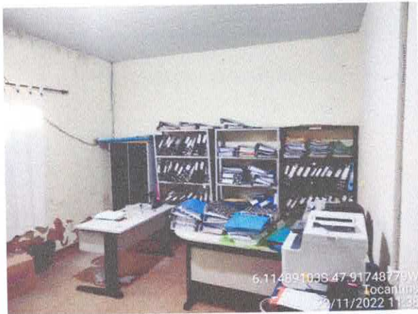
Foto 37: Sala da licitação: Vazamento do telhado. infiltração e paredes danificadas com revestimento solto.