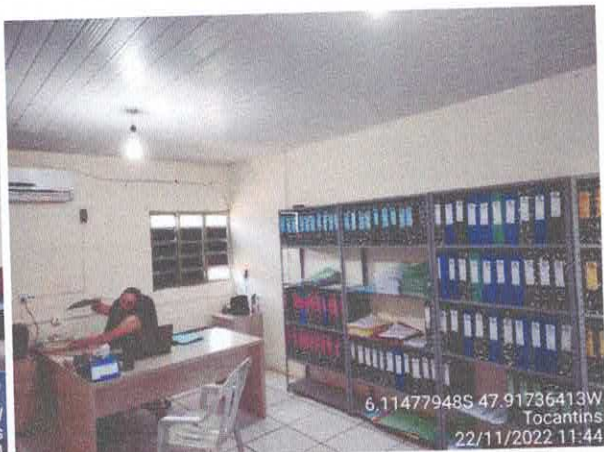
Foto 64: Sala da contabilidade a ser reformulada. Paredes a serem demolidas. Paredes com infiltração. Fiação exposta, esquadrias danificadas.