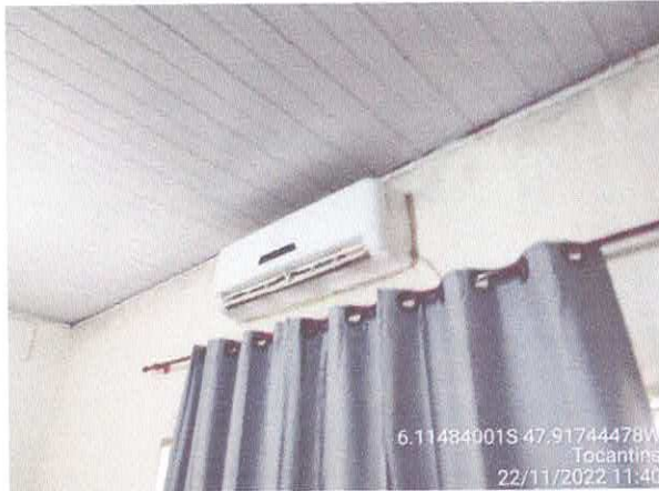
Foto 45: Sec. Educação: Vazamento do telhado. infiltração e paredes danificadas com revestimento solto, fiação exposta