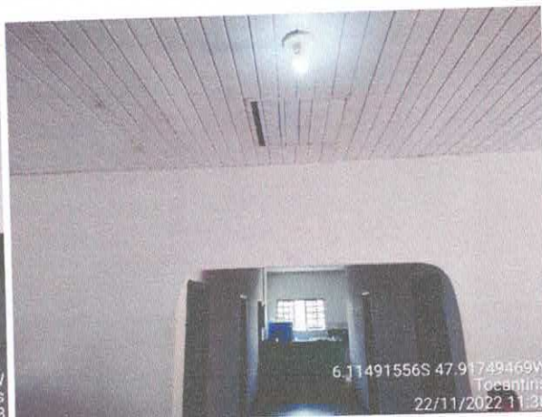
Foto 34: Vazamento geral do telhado. Telhas quebradas e calhas danificadas.