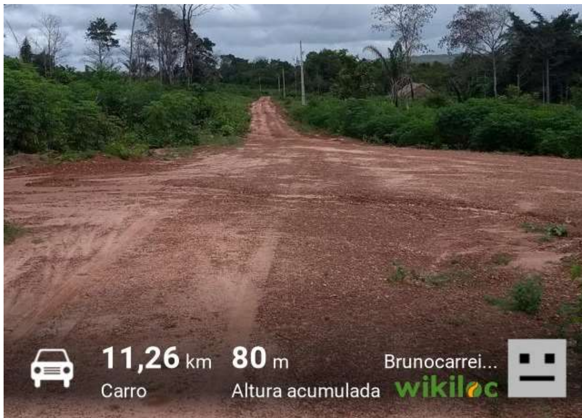
Foto 03: Região Aldeinha - Final do Trecho 02 Coordenadas: Latitude: -6.099724; Longitude: -47.832531