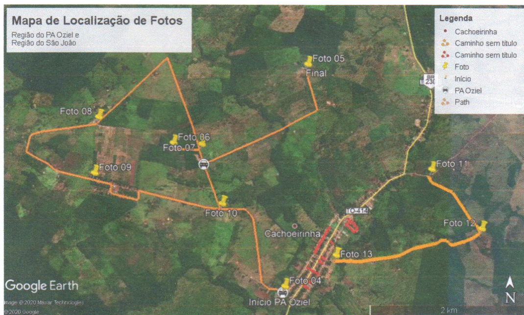
Imagem 02: Mapa de Localização das Fotos – Região PA Oziel e São João