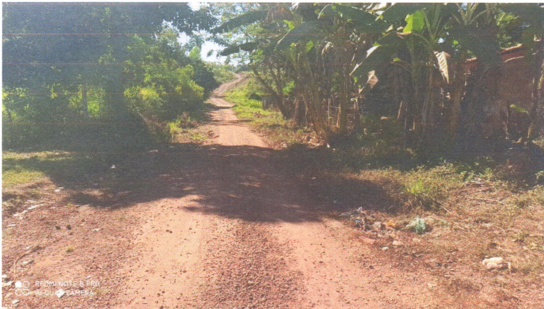
Foto 13: Região São João – Final do Trecho 05 Coordenadas: Latitude: - 6.114134; Longitude: - 47.932366