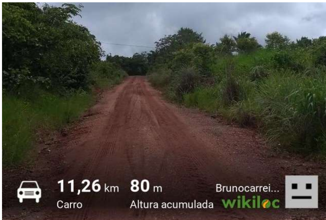
Foto 01: Região Aldeinha - Início Trecho 01 Coordenadas: Latitude: -6.101604; Longitude: -47.898728