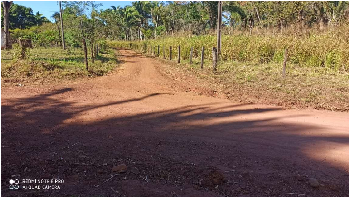
Foto 11: Região São João – Início do Trecho 05 Coordenadas: Latitude: - 6.123535; Longitude: - 47.925116