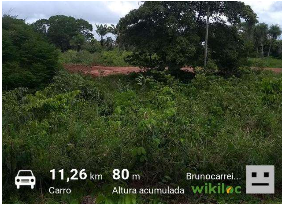
Foto 02: Região Aldeinha – Jazida de Cascalho Coordenadas: Latitude: -6.073654; Longitude: -47.864415