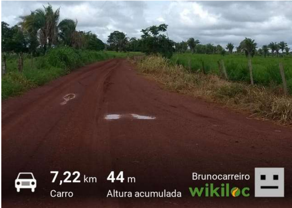
Foto 07: Região PA Oziel - Início do Trecho 04 Coordenadas: Latitude: -6.107582; Longitude: -47.938105