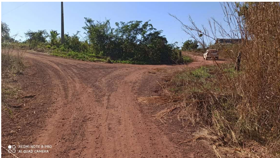
Foto 08: Região PA Oziel - Meio do Trecho 04 Coordenadas: Latitude: -6.104798; Longitude: -47.946626