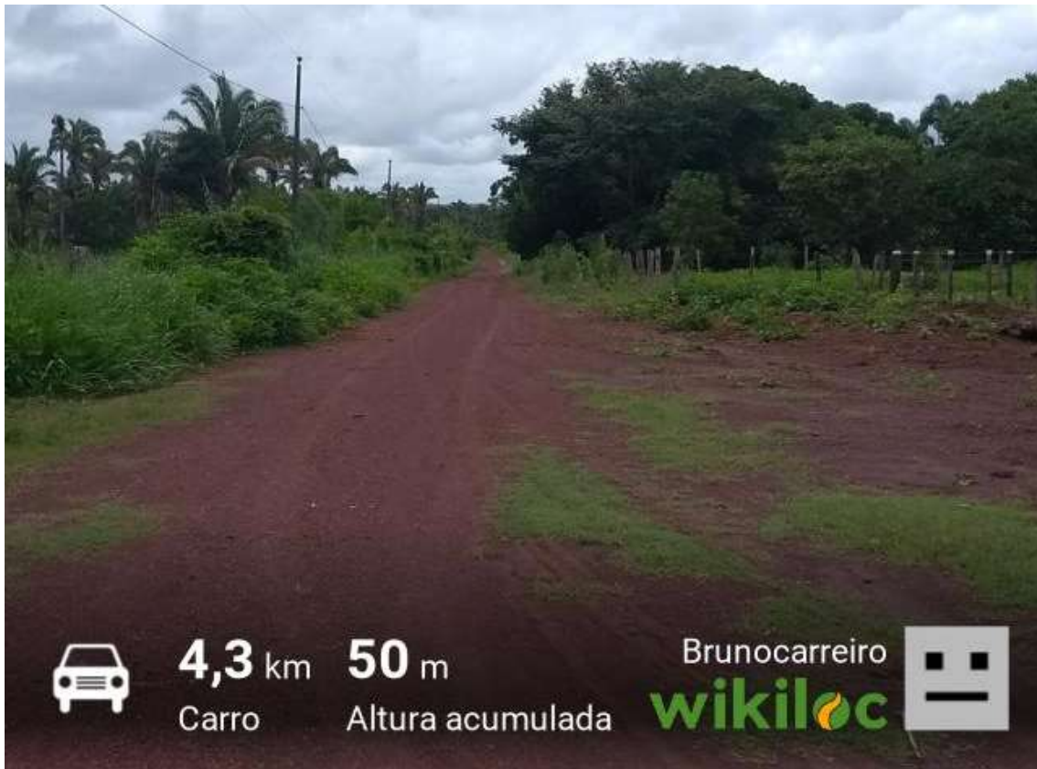
Foto 05: Região PA Oziel - Final do Trecho 03 Coordenadas: Latitude: -6.098280; Longitude: -47.922952