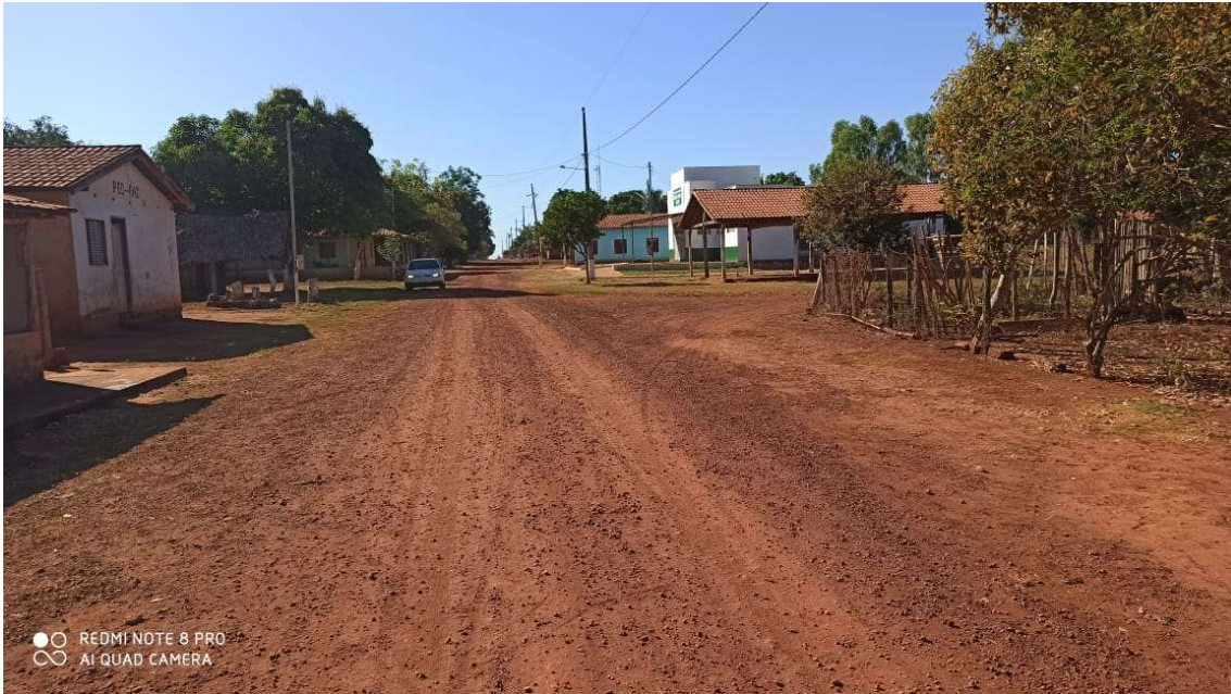
Foto 09: Região PA Oziel – Agrovila Trecho 04 Coordenadas: Latitude: - 6.111547; Longitude: - 47.945072