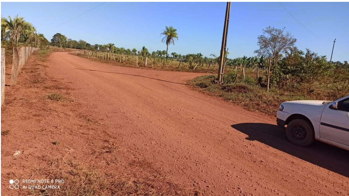
Foto 10: Região PA Oziel - Final do Trecho 04 Coordenadas: Latitude: - 6.114134; Longitude: - 47.932366