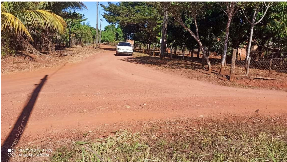
Foto 12: Região São João – Meio do Trecho 05 Coordenadas: Latitude: - 6.116492; Longitude: - 47.902498