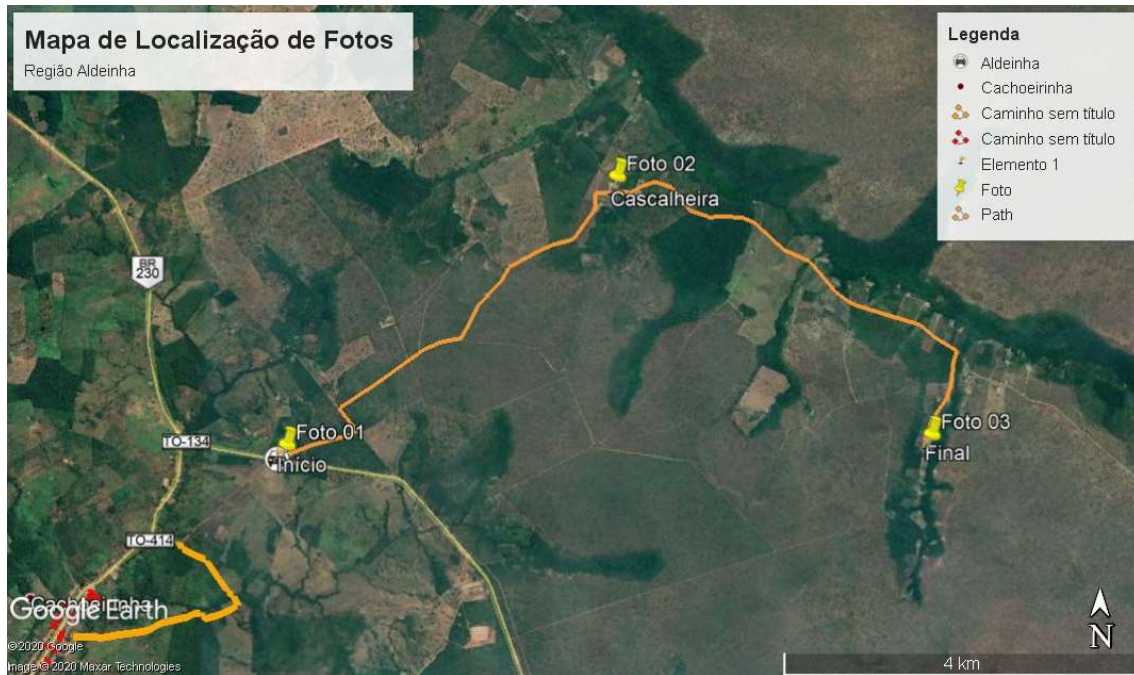
Imagem 01: Mapa de Localização das Fotos – Região Aldeinha