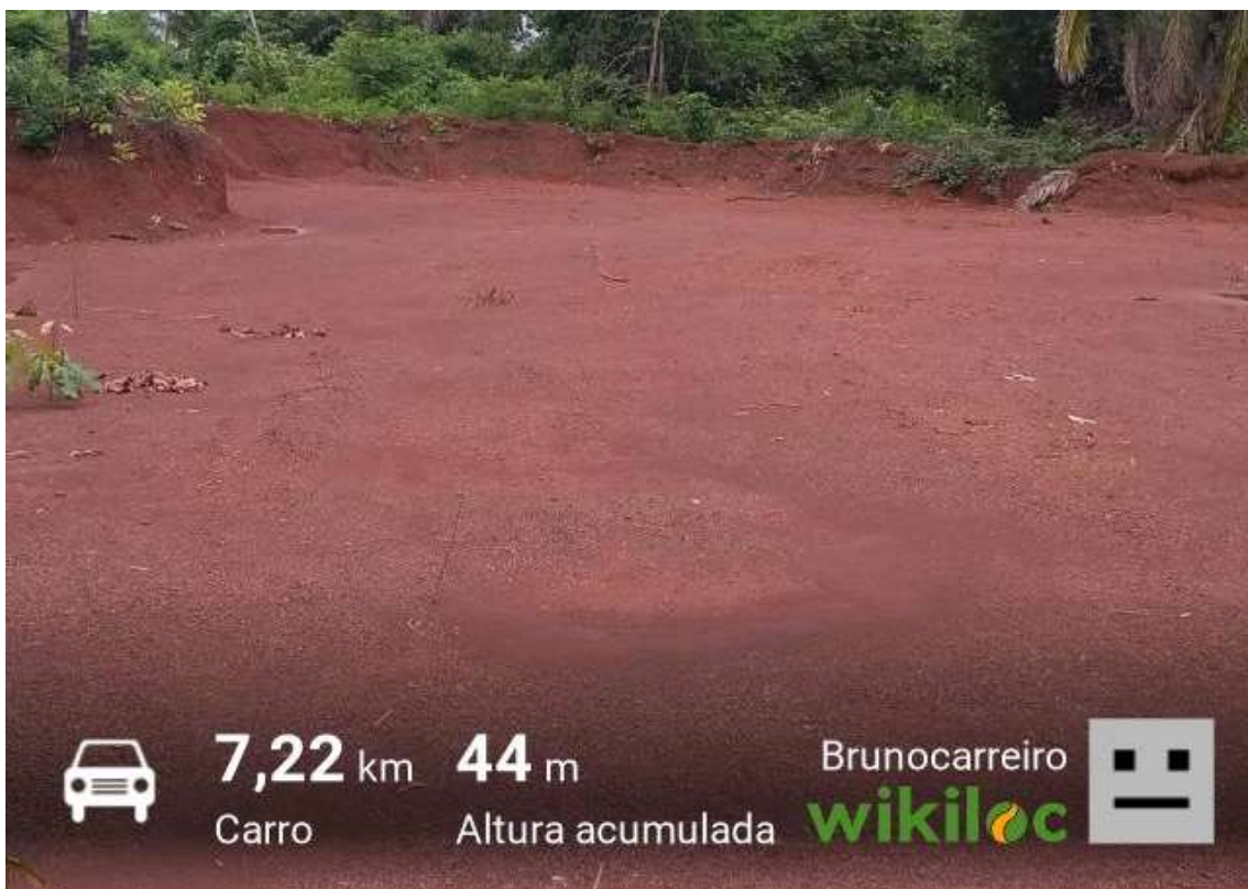
Foto 06: Região PA Oziel – Jazida de Cascalho Coordenadas: Latitude: -6.107538; Longitude: -47.934869