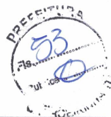
PAULO MACEDO DAMACENA Prefeito Municipal

Gabinete do Prefeito de Cachoeirinha – TO, aos 26 dias do mês de outubro de 2023.