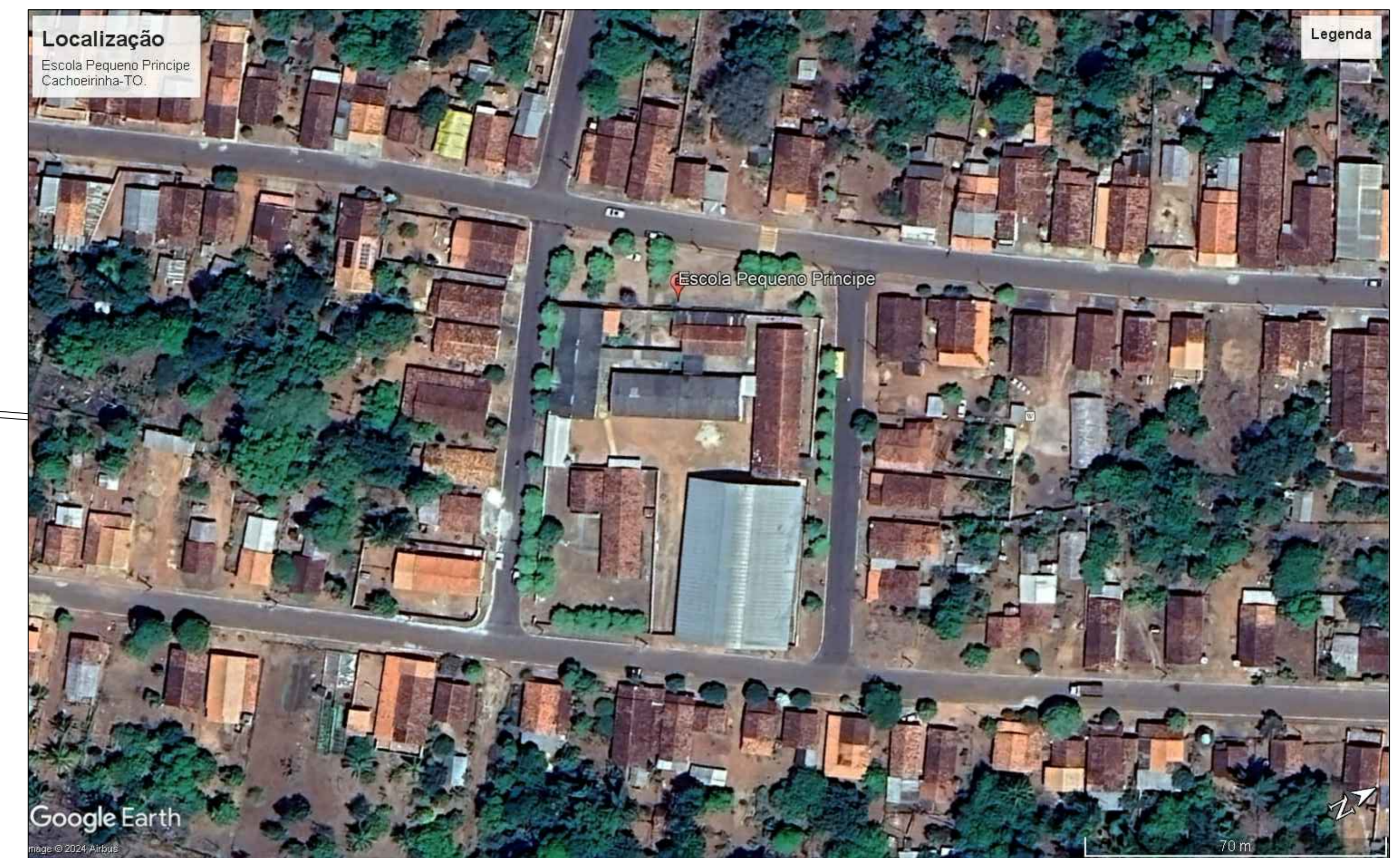
LOCALIZAÇÃO DA ESCOLA COORDENADAS: LATITUDE: -6.122477° / LONGITUDE: -47.922506°