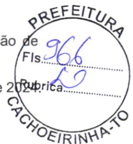
PAULO MACEDO DAMACENA PREFEITO MUNICIPAL

Cachoeirinha - TO, aos 19 de abril de 2024.